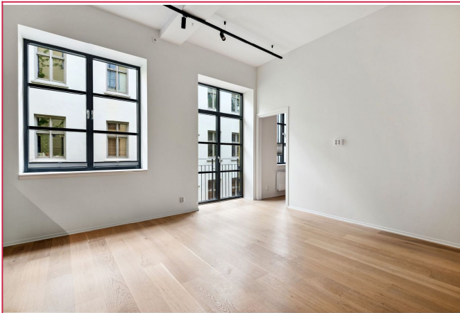
Store vindusflater. Utgang til fransk balkong.