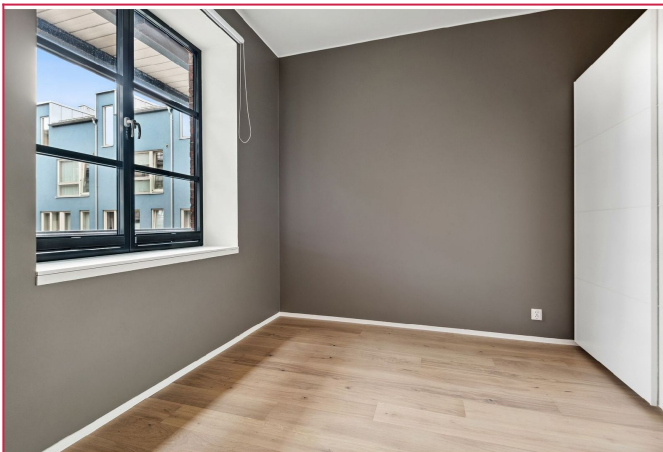
Soverom med garderobeskap