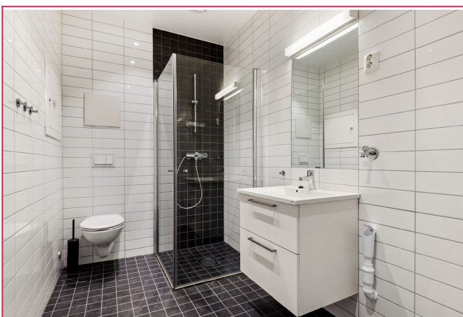
Pent flislagt bad med opplegg til vaskemaskin