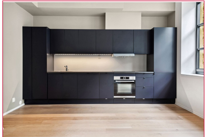
Lekker kjøkken med integrerte hvitevarer.