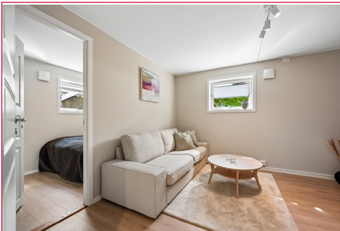
Lys og fin stue