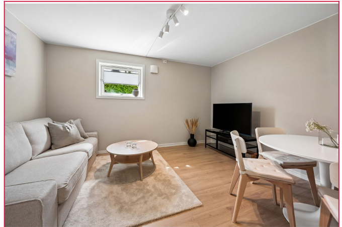
Lys og fin stue