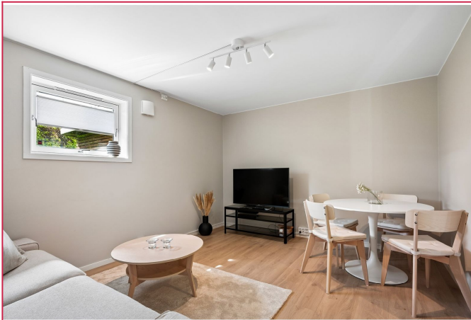
Fin og oppusset leilighet