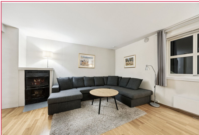
Stue med kamin for kjørlige dager