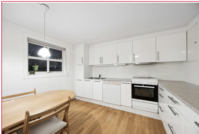
Romslig kjøkken med mye skap og benkeplass. Det er medfølger hvitevarer.