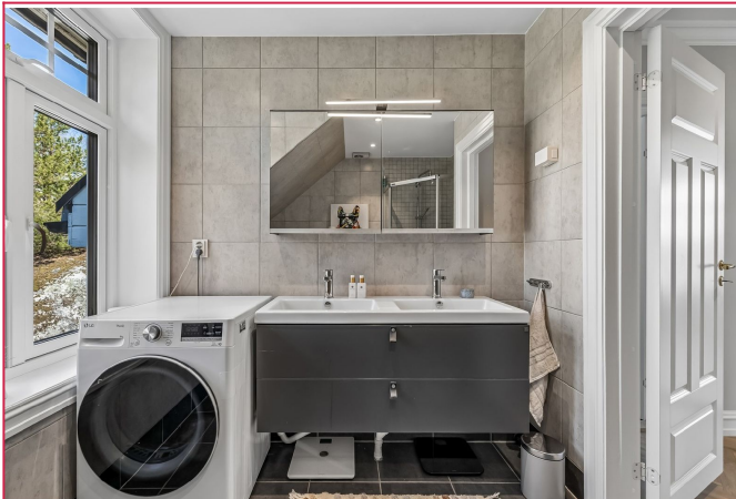
Delikat badertom i 2. etasje med dobbelservant og overspeil