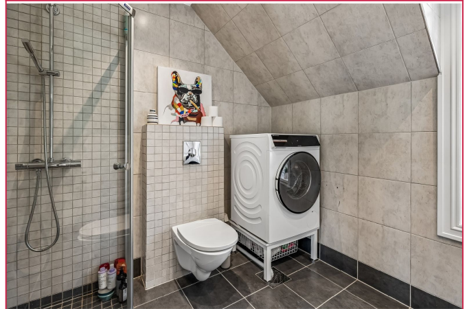
Delikat hovedbad i 2. etasje - Flislagt med varmekabler