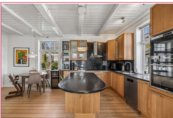
Klassisk og stilrent kjøkken med god plass til spisegruppe