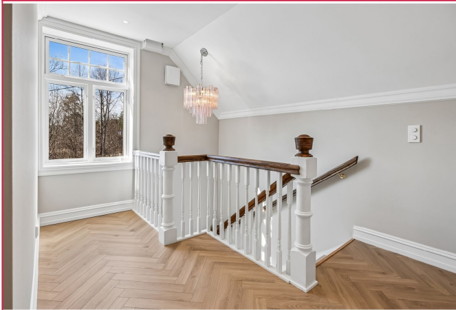
Trappehall i 2. etasje