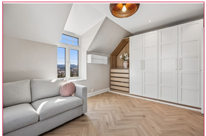
Lyst og stort soverom nummer 2 med lekkert garderobeskap