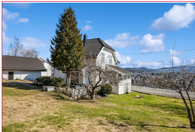
Stor tomt med gode solforhold og utsikt