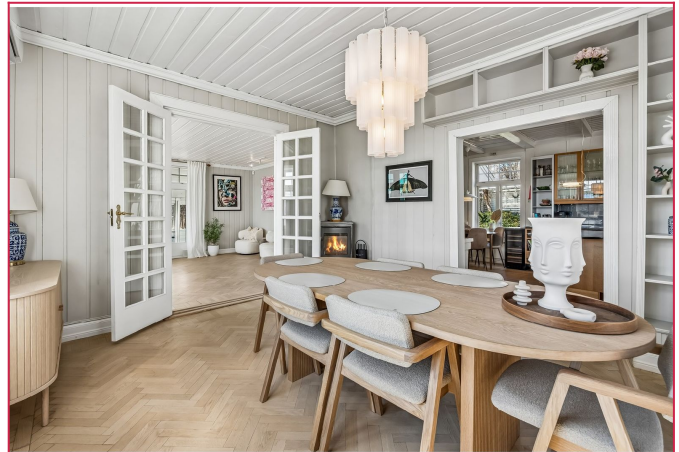
Lekker og innbydende spisestue med direkte inngang til kjøkken