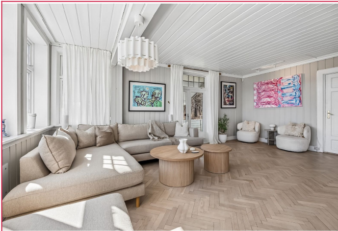
Romslig og lys stue med god plass til sofakrok - Direkte utgang til terrasse