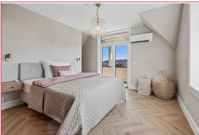
Hovedsoverom med walk-in-closet og direkte utgang til balkong