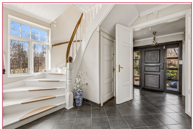
Lekker og luftig flislagt entré med varmekabler i gulv