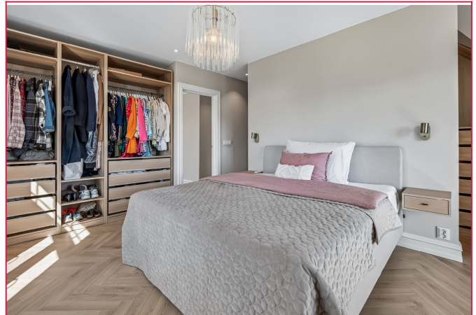
Romslig hovedsoverom med gode oppbevaringsmuligheter