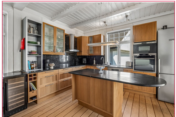
Klassisk og stilrent kjøkken med egen kjøkkenøy