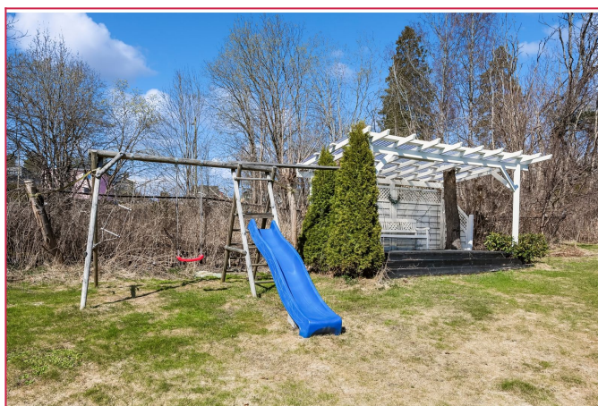
Flott og barnevennlig på tomten rundt huset