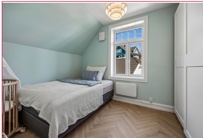
Lyst og lekkert soverom nummer 3 - god lagringsplass