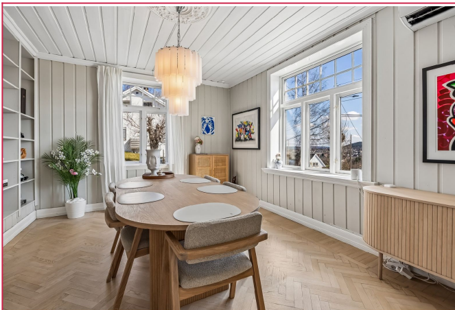
Spisestuen har stor vinduer som gir mye naturlig lys og en behagelig atmosfære