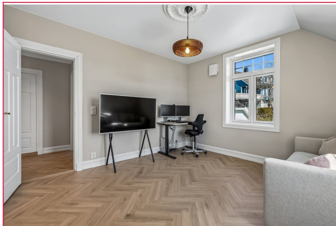
Soverom nummer 2