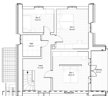
Plantegning - 2. etasje