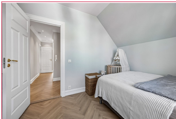
Soverom 3 med god plass til dobbeltseng og oppbevaring i form av garderobeskap