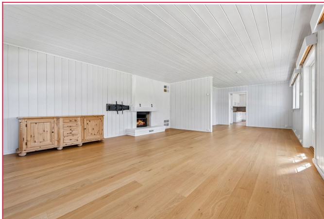
Denne boligen har en stor stue med en hyggelig peis.