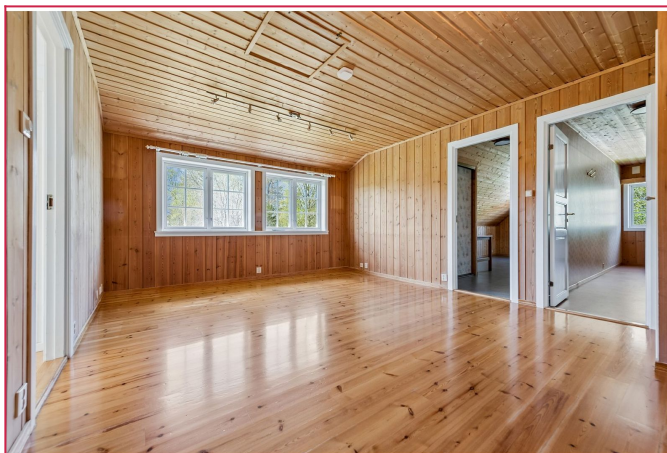
Stue i andre etasje mellom soverommene.