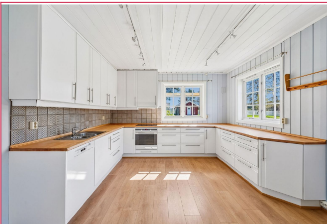
Kjøkkenet i egen sone.