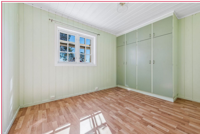
Soverom 2 er av god størrelse med garderobeskap.