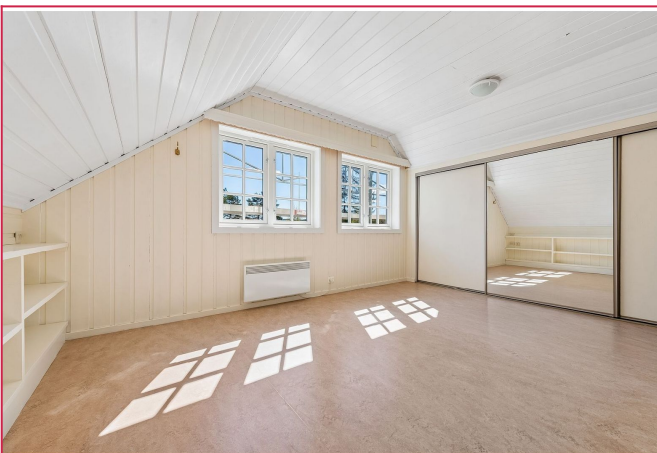
Hovedsoverom med garderobe.