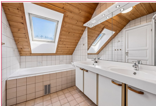
Baderom med både badekar og dusj.