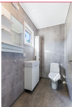
Bad. vaskemaskin er oppført nede i kjeller.