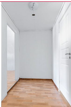
Inngangsparti med dør til bad og stue.