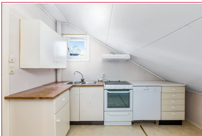
kjøkken med tilhørende oppvaskmaskin.