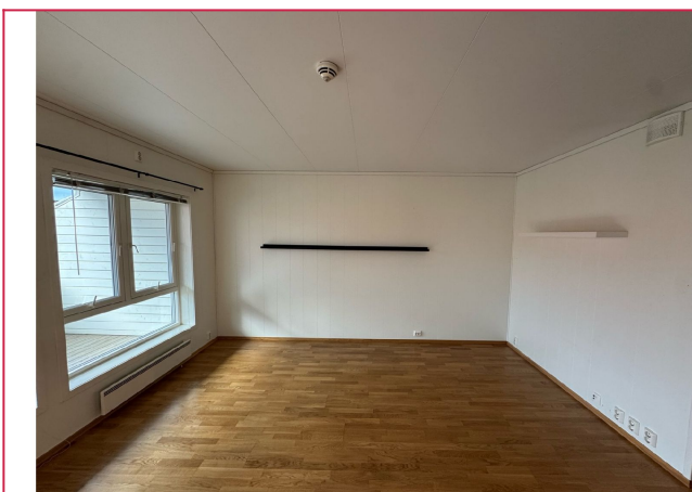
Store vindusflater som slipper inn mye naturlig lys og utgang til veranda.