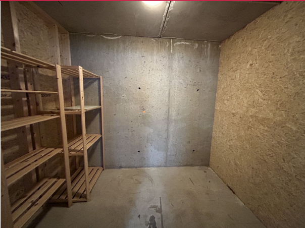
Medfølgende bod av god størrelse.