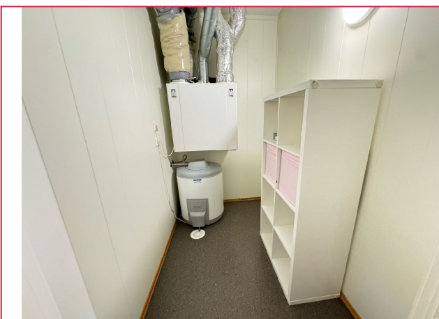
Innvendig bod og teknisk rom.