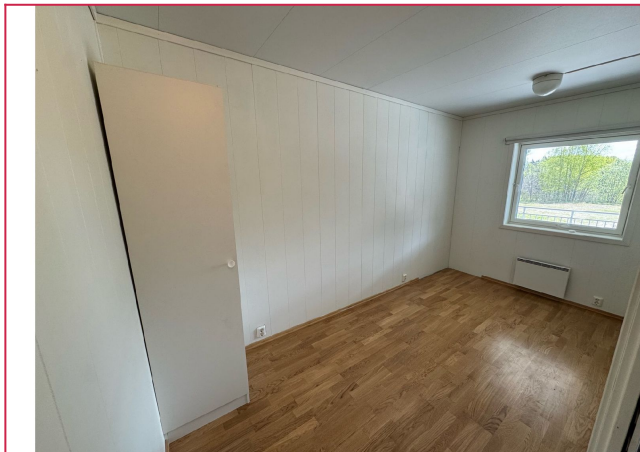
Soverom 1 er det største av de to soverommene.