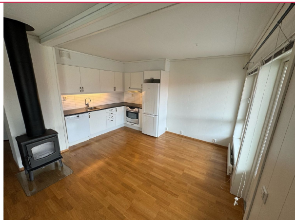
Kjøkkenet og spise plass med vedovn mellom stue og kjøkken.