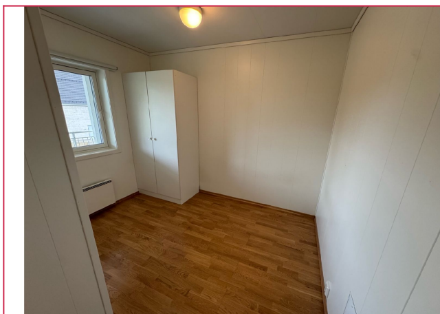
Soverom 2 er litt mindre, men får inn ønsket møblement her.