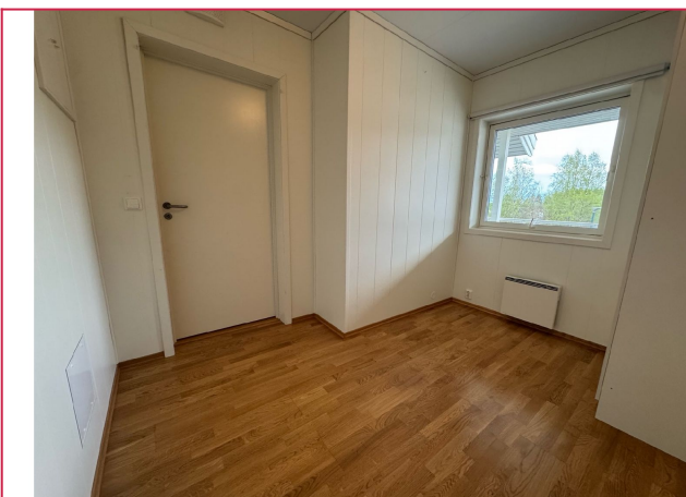
Soverommene har panelovn som oppvarmingskilde.