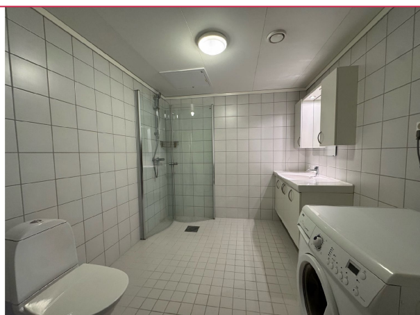
Badet er romslig og har bred servant, vaskemaskin, dusj og toalett.