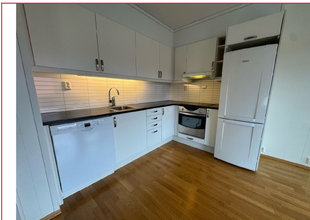
Kjøkkenet har det man behøver av hvitevarer der platetopp og stekeovn er integrert.