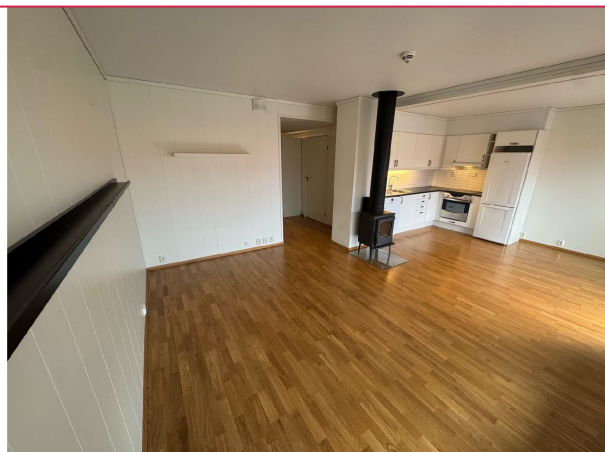
Stuen gir plass til sofagruppe og stuebord.