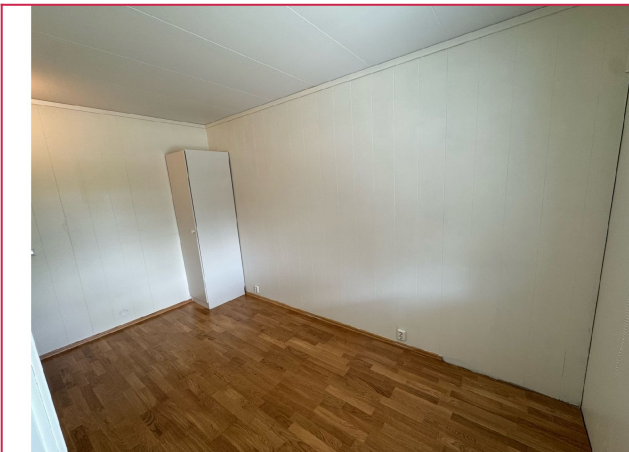
Her er det plass til en stor seng og ekstra kommode.