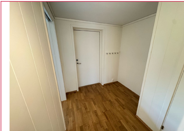
Entre med plass til kormmode eller skap.