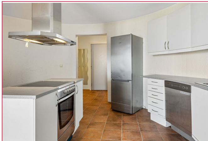
Separat kjøkken med god skapplass og tilhørende hvitevarer.