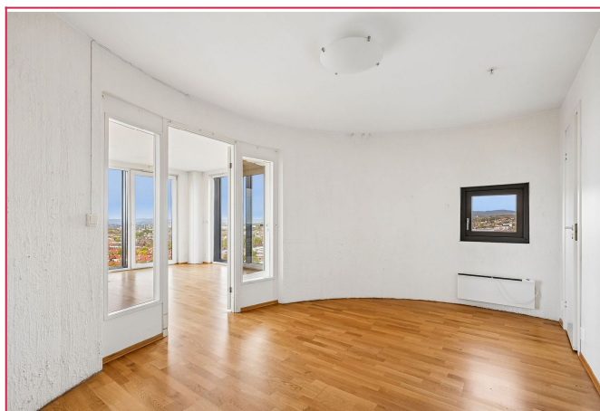
Disponibelt rom, tidligere benyttet som soverom. Direkte tilgang til garderobe plass og bad.