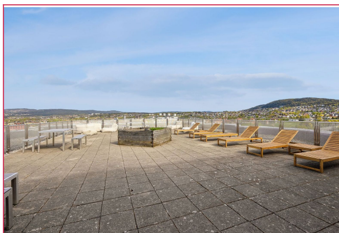
Beboere har tilgang på flott felles takterrasse med fantastisk utsikt over Oslo.