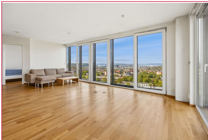
Romslig stue med god plass til sofagruppe og spisebord.