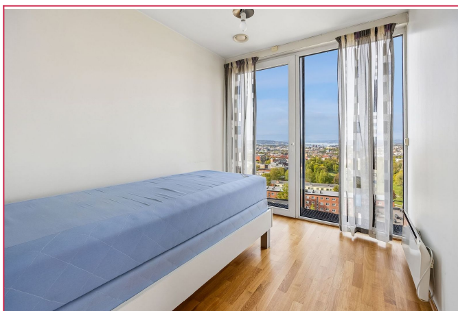
Soverom med fantastisk utsikt.