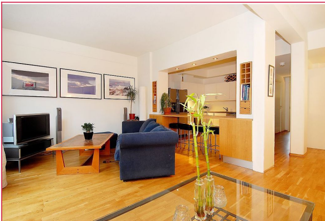
Stue med gode møbleringsmuligheter