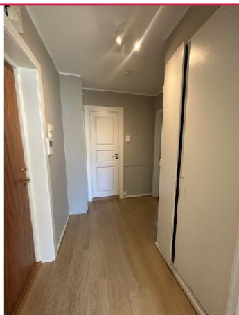
Gang med garderobeskap