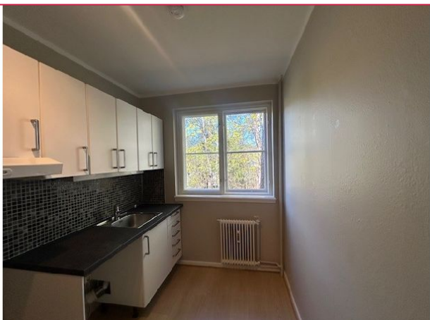
Kjøkken med plass til hvitevarer, dette må man kjøpe selv