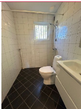
Bad med dusj og opplegg vaskemaskin