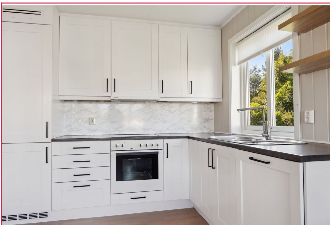
Et funksjonelt og stilrent kjøkken med godt med oppbevaring og arbeidsflate.