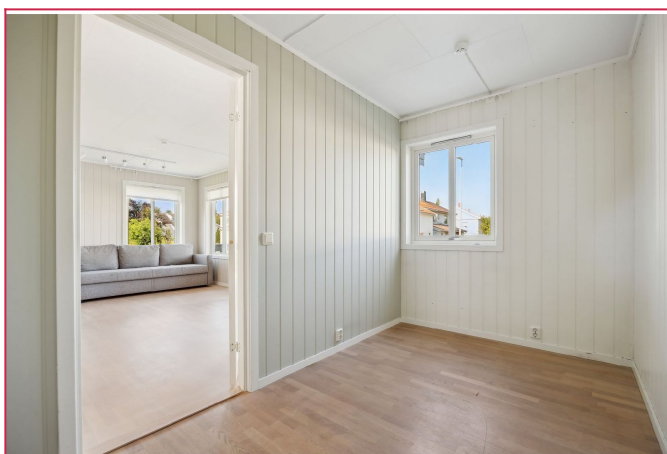
Soverommet ligger vegg i vegg med stuen, og på ca. 7 kvm gir det plass til både seng og oppbevaring.