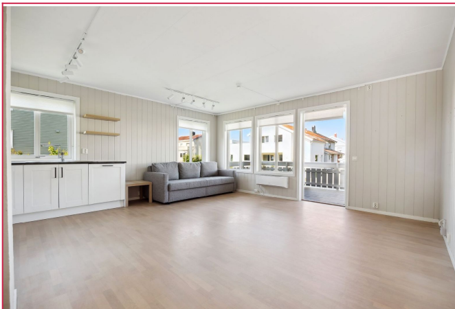
Videre åpner boligen seg opp med en romslig stue- og kjøkkenløsning med flotte møbleringsmuligheter.