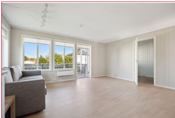
Herfra har du utgang til en solrik terrasse som forlenger oppholdsrommet utendørs.