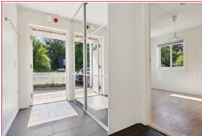
Allerede i det du trår inn døren, møtes du av en lys og romslig gang.