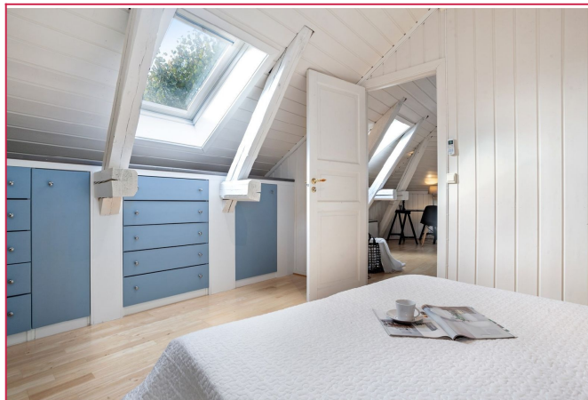
Godt med skapplass