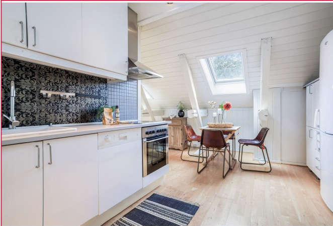
Flott kjøkkeninnredning med mye skap- og benkplass