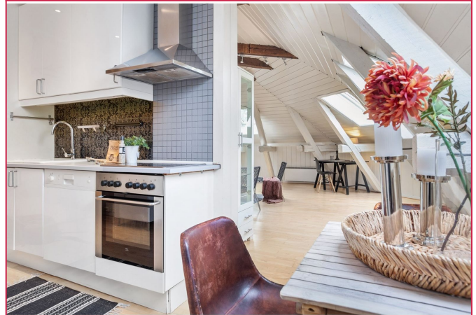
Kjøkkenet har hvite fronter