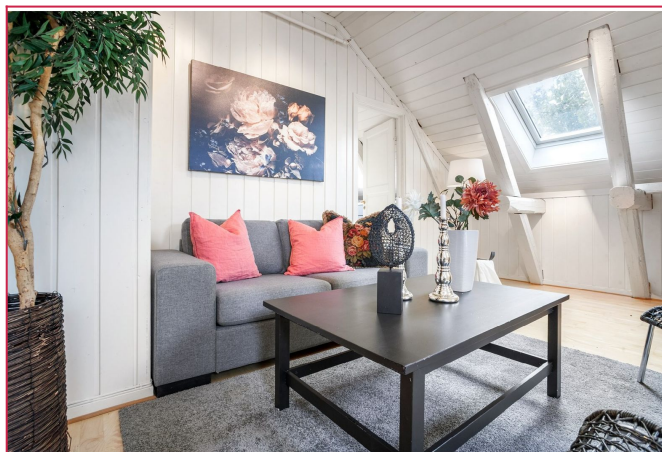
Lys og fin stue