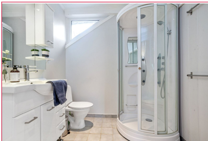
Bad med toalett, hjørnedusj og servant m/innredning