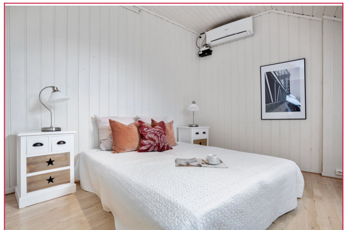
Stort soverom med plass til dobbeltseng