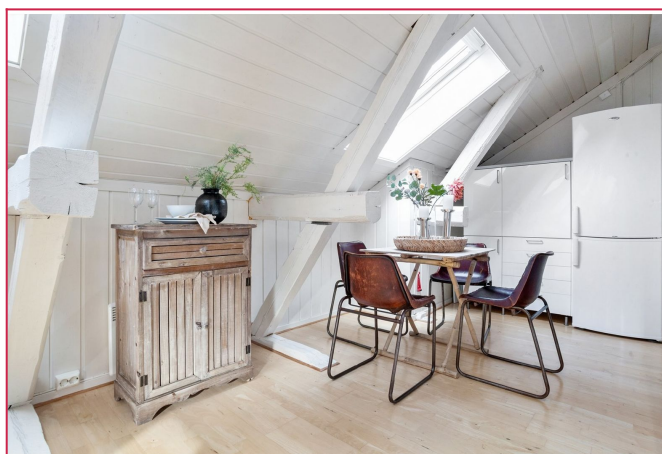
Plass til spisegruppe