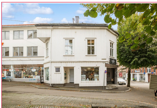
Boligen ligger sentralt i Tønsberg sentrum