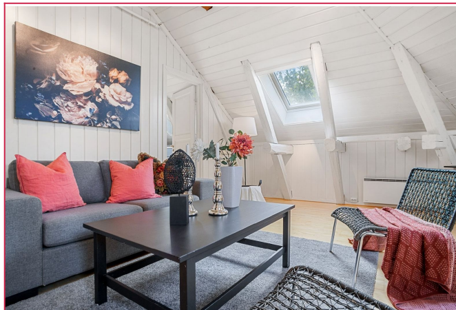
Stor stue med god takhøyde!