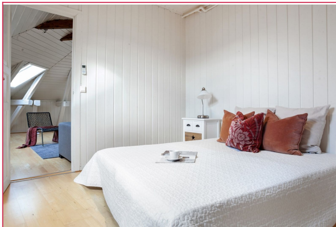
Soverommet har varmepumpe