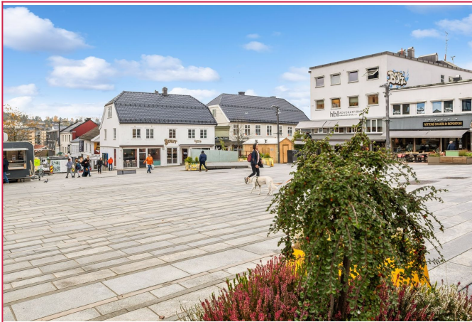
Velkommen til visning!