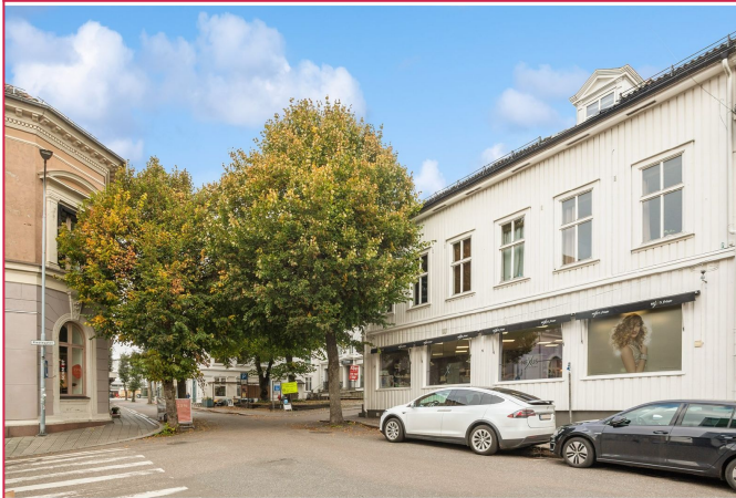
Leiligheten ligger i 3.etg