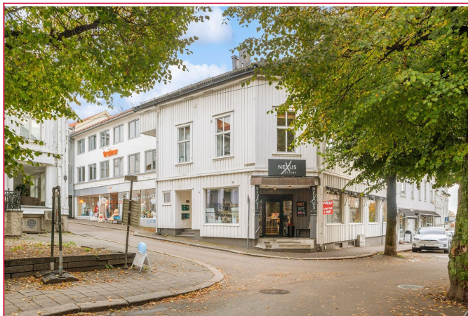
Sjelden 2-roms loftsleilighet midt i byen!