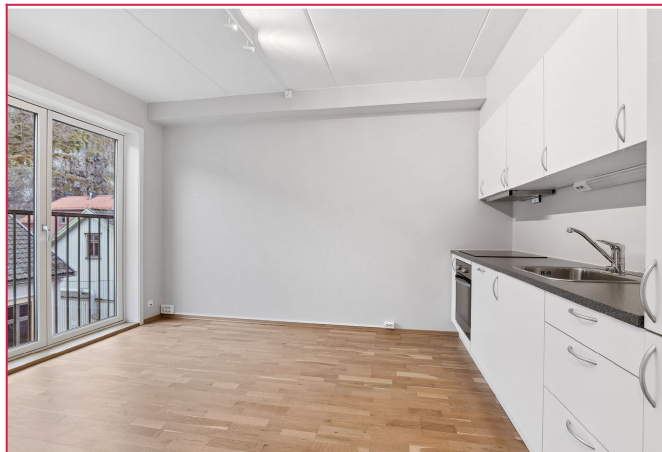
Åpen kjøkkenløsning med integrerte hvitevarer