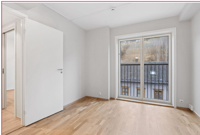
Lys og fin stue!