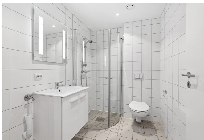
Pent, flistlagt bad med varmekabler i gulv og opplegg for vaskemaskin