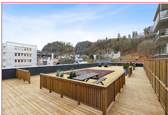
Stor felles takterrasse i samme etasje som leiligheten