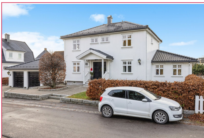
En bolig som bør sees, Velkommen til visning!