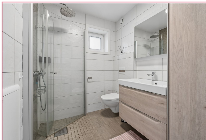
Lekker flislagt bad