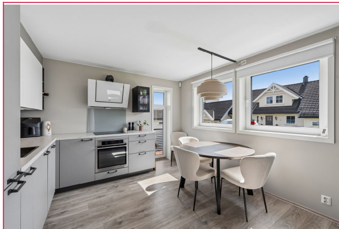
Kjøkken med plass til spisebord