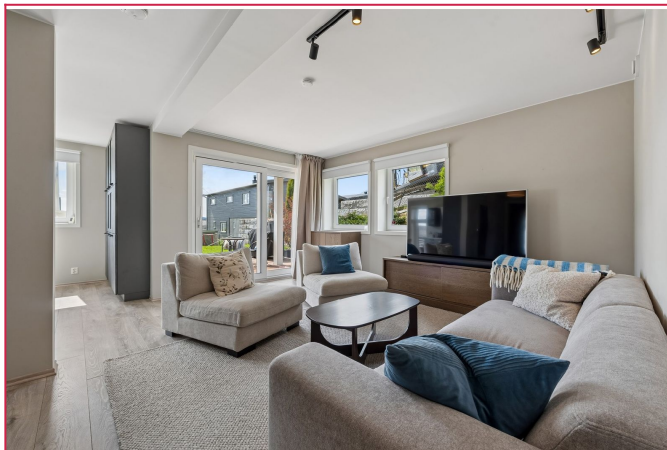
romslig stue med utgang til fine uteområder