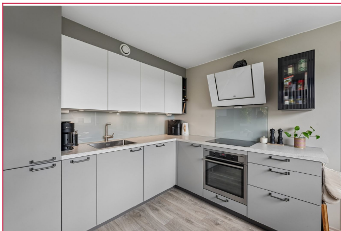
Kjøkken med integrerte hvitevarer