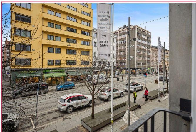
Utsikt fra fransk balkong.