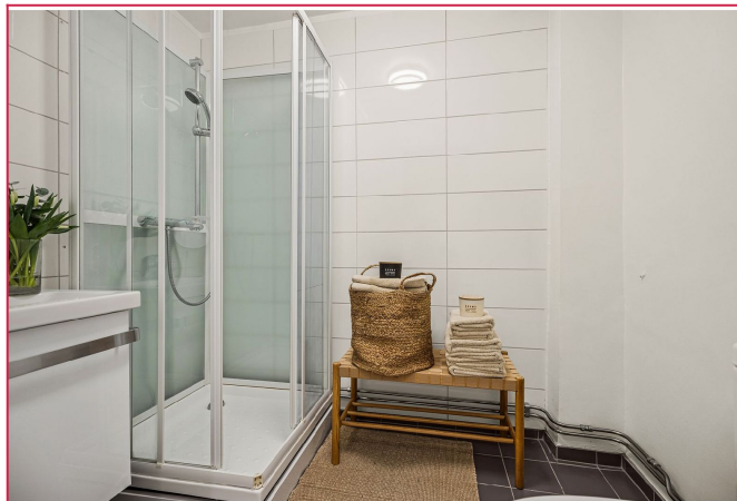
Det er tilgang til felles vaskerom i kjeller.