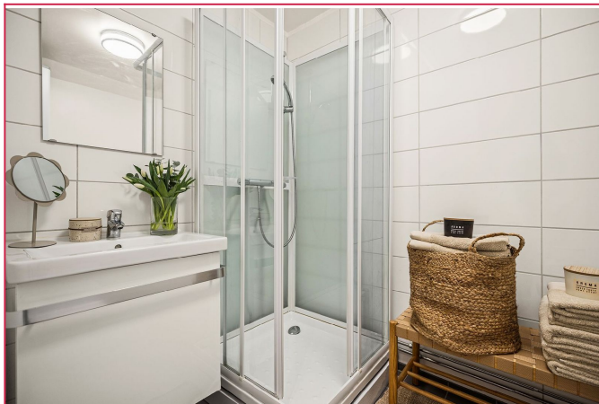
Flislagt bad med gulvvarme.

SAKSNUMMER 66234 - BOGSTADVEIEN 34, 0366 OSLO