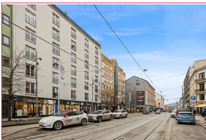
Meget sentral og populær beliggenhet i Bogstadveien. Her har man alle fasiliteter like utenfor døren!