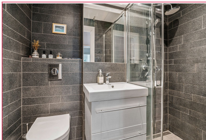
Pent flislagt bad