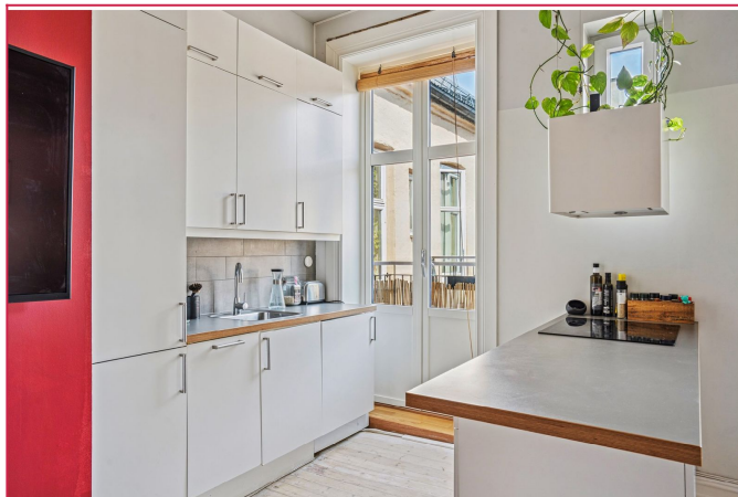
Kjøkken med kjøkkenøy