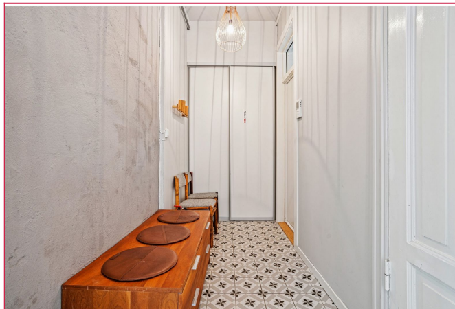
Romslig entré med garderobe/oppbevaring