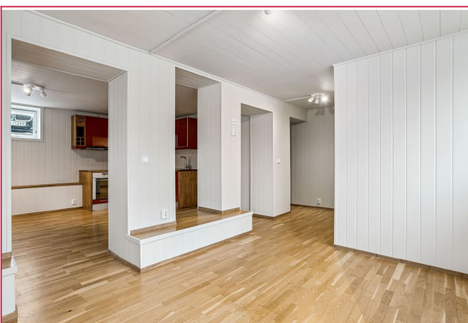
Det er idag en dør i vegg under lyset.