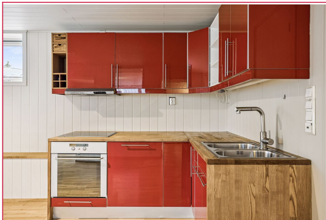
Hyggelig kjøkken med komfyr