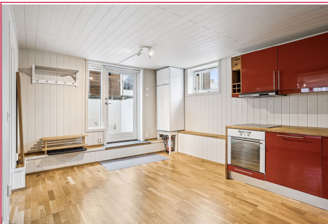
Velkommen til visning