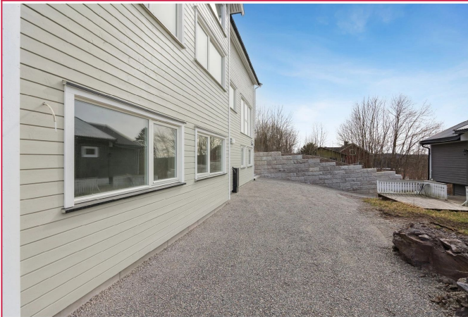
Helt ny 3-roms leilighet på Gullhaug!