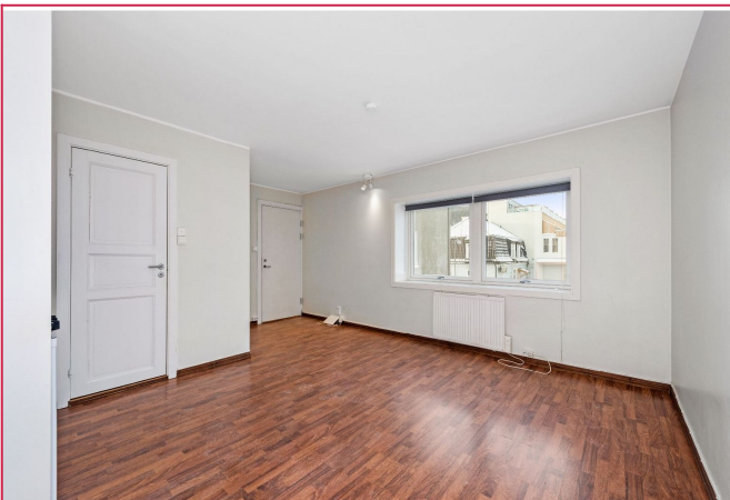
Leiligheten har opplegg for Altibox tv og internett.