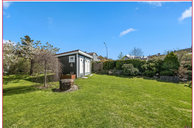
Hage (Utleier vil disponere boden til lagring i utleieperioden)