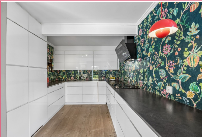
God skap- og benk plass på kjøkkenet