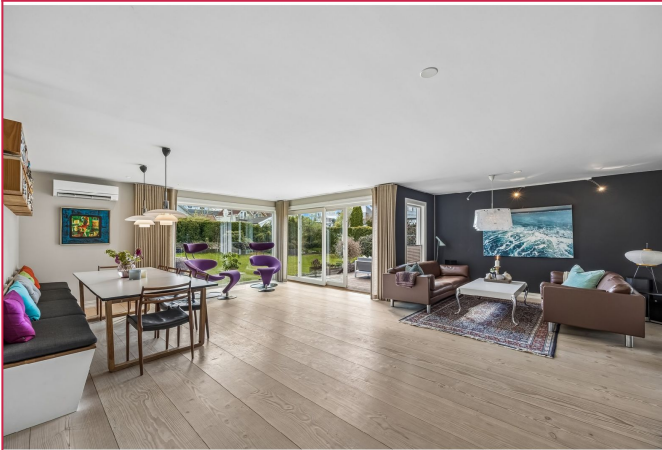
Åpen stue-/kjøkkenløsning med store vindusflater og god plass til spisegruppe og sofagruppe