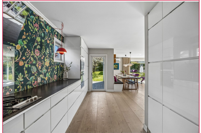
Kjøkkenet med integrerte hvitevarer