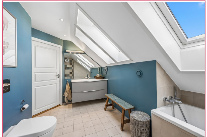
Bad 2. etasje