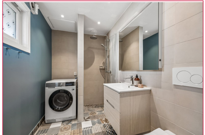
Bad 1. etasje