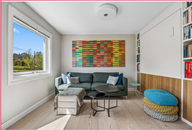
TV-stue/gjesterom med skapseng