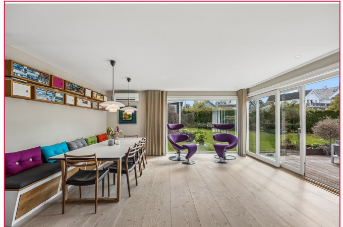
Stue med store vindusflater og skyvedør ut til terrassen