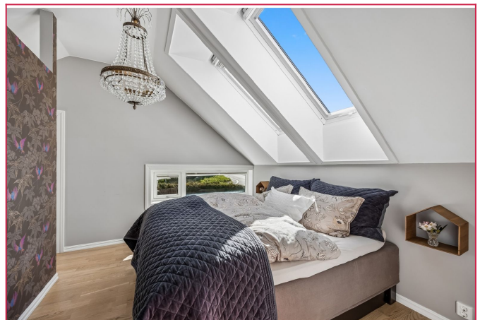
Hovedsoverom med walk-in closet