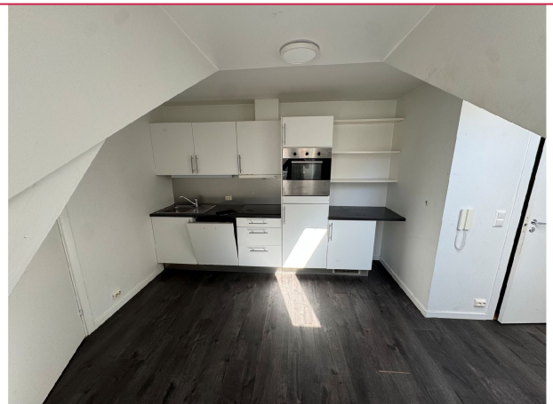
Kjøkkenet har god med skap og benkeplass.