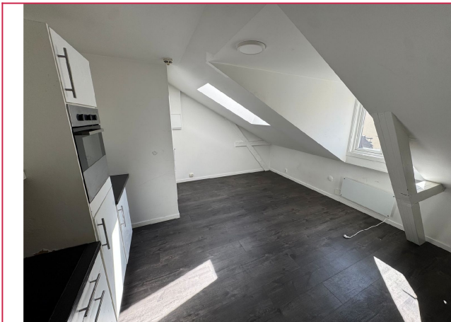
Store vinduer som sørger for naturlig lys.