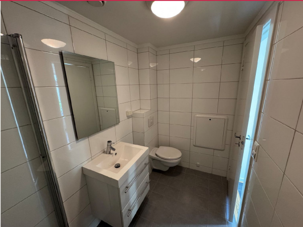
Pent flislagt bad med varmekabler i gulv.