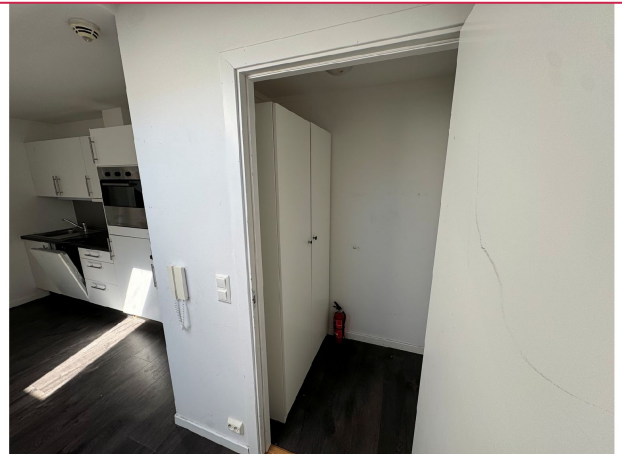
Entre med plass til å henge av seg yttertøy i garderobeskap.