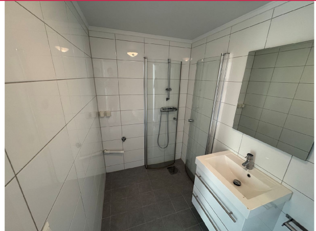
Opplegg til vaskemaskin på bad.