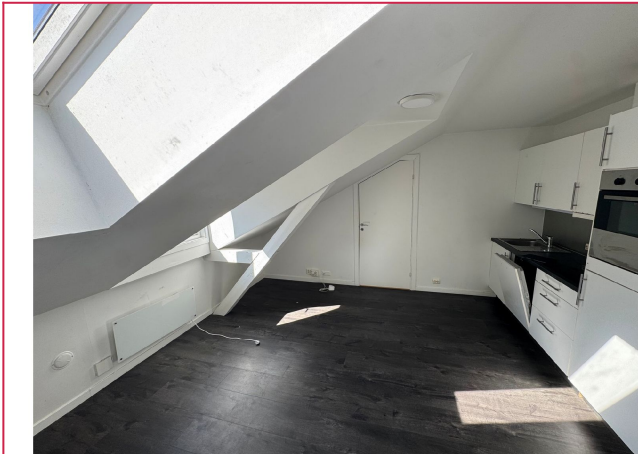
Åpen stue og kjøkkenløsning.