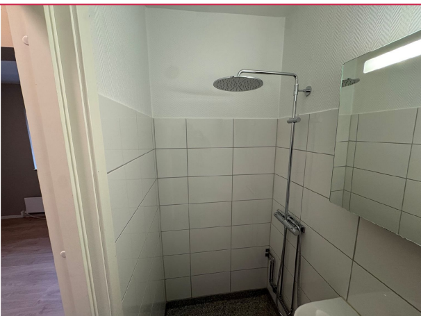
Bad har ikke varmekabler i gulv.