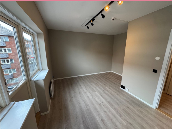
Romslig og lys stue.