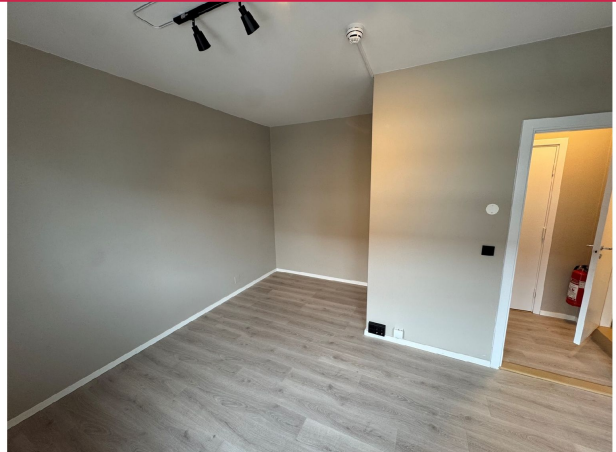
Plass til seng av god størrelse.