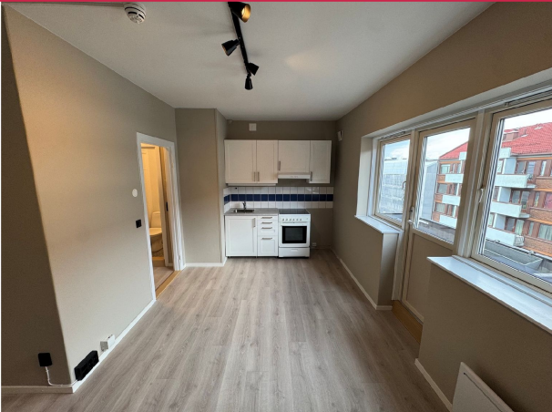
Kjøkkenet har godt med skaplass. Komfyr følger med så lenge den virker.