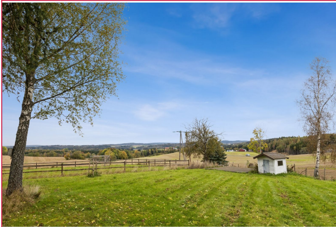
Stille og rolig nabolag