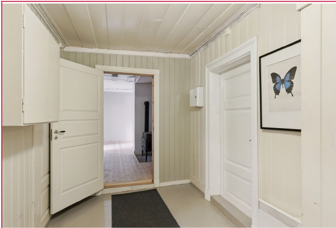
Entrè til leiligheten