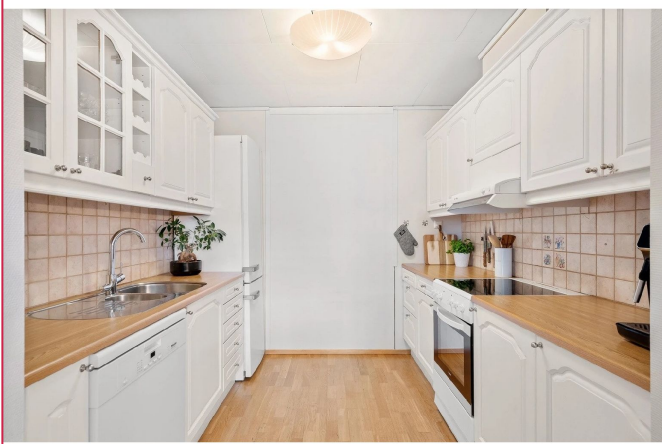
Kjøkkenet er lyst og pent med rikelig skap-og benkeplass