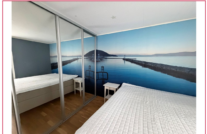
Soverom 1 - Alle soverommene har rikelig oppbevaring med garderobeskap