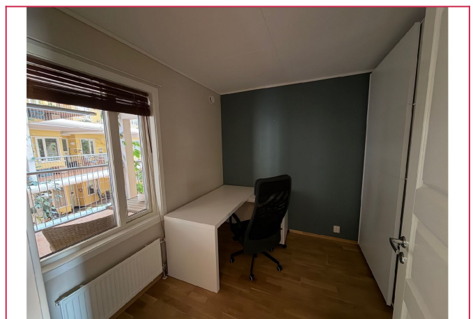
Soverom 3- brukes idag som kontor