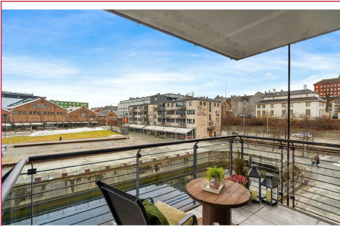
Flott balkong - Her kan du virkelig nyte utsikten og kjenne på bylivet!