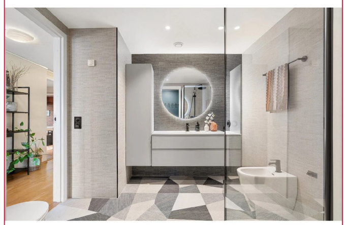
Nyere bad med flotte detaljer!