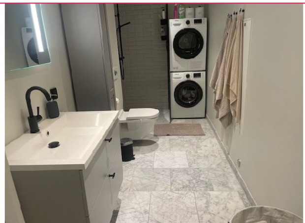
Lekker flislagt bad