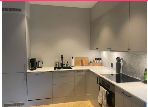
Kjøkkenet med integrerte hvitevarer