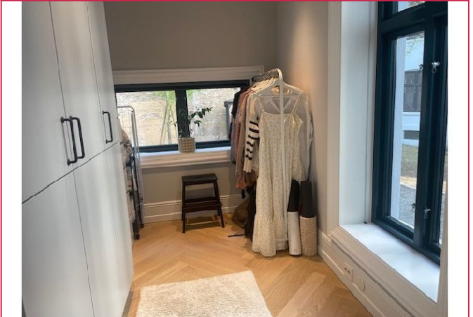
Egen garderobedel evt kontor