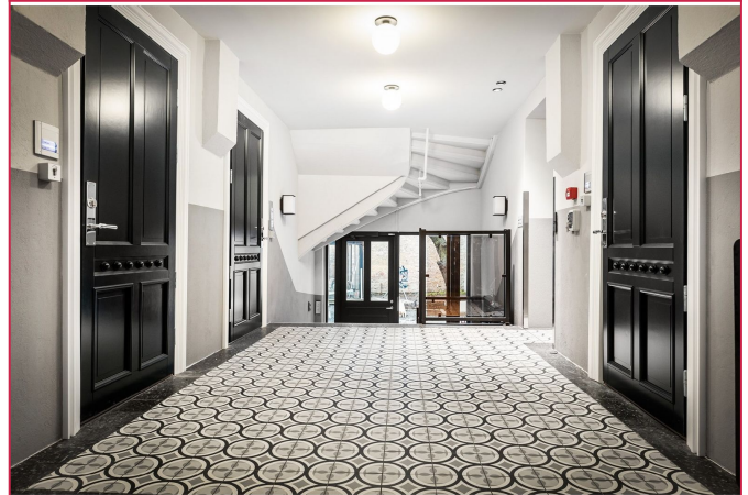
Meget flott og innbydende inngangsparti