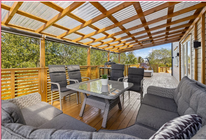
Terrasse med overbygg