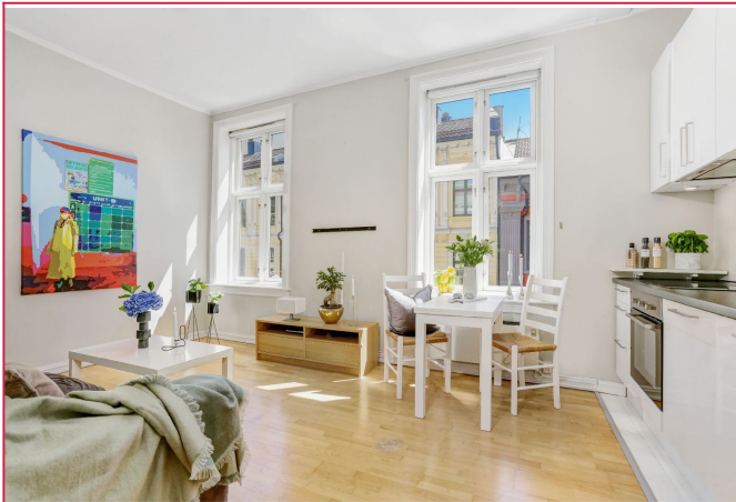
Det er god takhøyde i leiligheten med store vinduer og dype karmen.