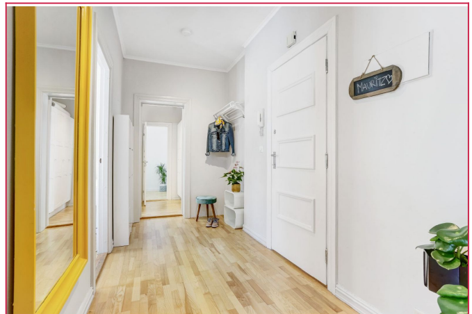
Entréen binder alle rommene sammen, i enden er det plass til ekstra lagring.