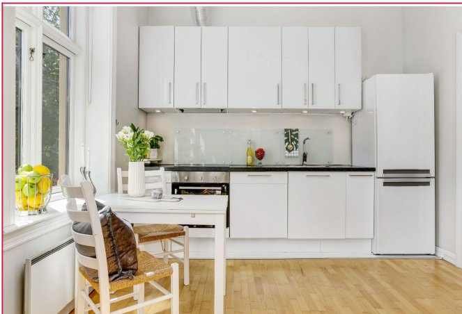
Kjøkkeninnredning fra 2016. God plass til spisebord med nærhet til vindu.