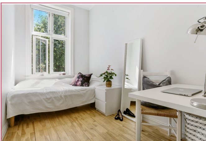
Leiligheten har tre gode soverom.