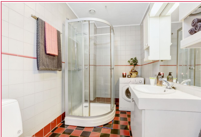
Flislagt bad med varmekabler og vaskemaskin.