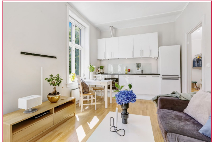
Flott 4-roms i klassisk bygård med åpen stue- og kjøkkenløsning.