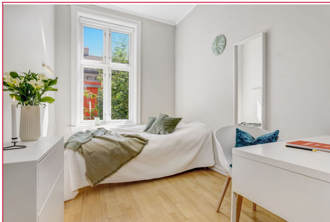
Dette er et særdeles attraktivt område.