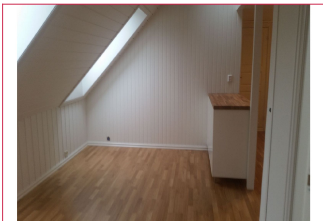
Stuen ble også pusset opp i 2015. Nytt gulv og malt.