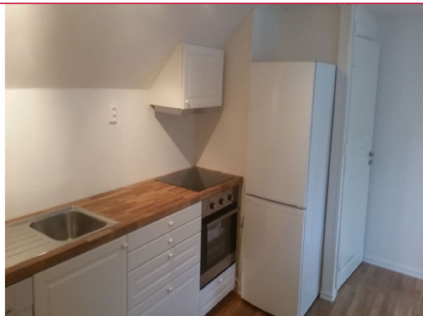
Kjøkkenen ble pusset opp i 2015. Utstyrt med komfyr, oppvask og kombi kjø/fryseskap.