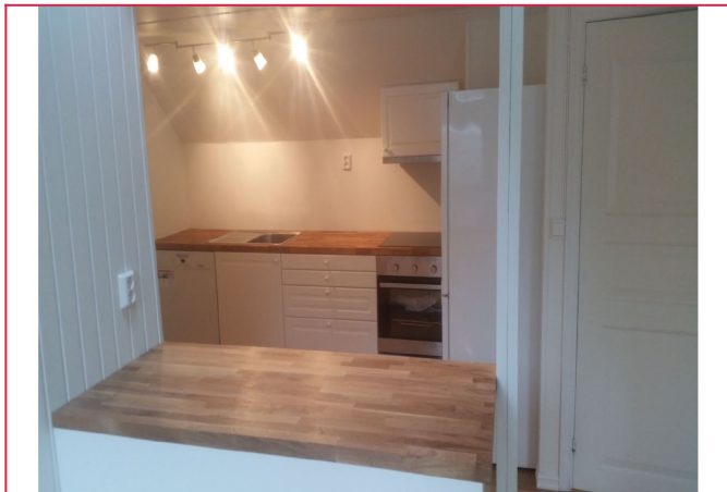
Praktisk løsning med kjøkkenøy/benk som et naturlig skille mot stuedelen.