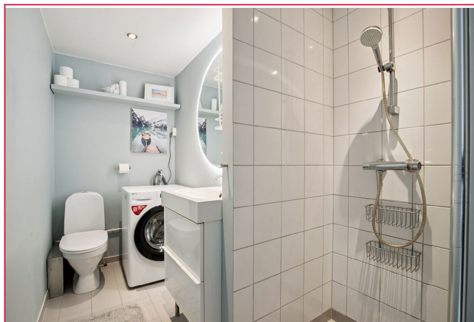
Baderom med vaskemaskin.