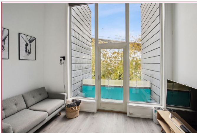
God takhøyde som gir en luftig atmosfære.