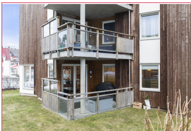
Terrasse ( grunnplan)