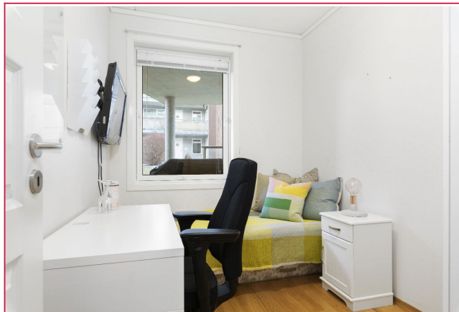
Soverom ( leies ut umøblert)