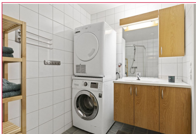
Bad ( vaskemaskin/tørketrommel medfølger ikke)