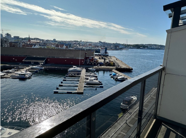
Utsikt fra balkong