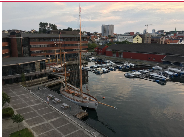
Utsikt fra balkong