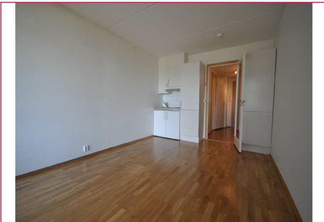
Stue og kjøkken