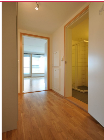
Gang med skaplass