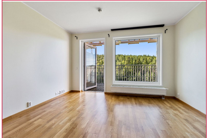
Stuen er av god størrelse med flere møbleringsmuligheter.