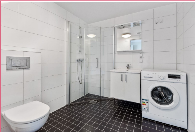
Pent flislagt bad med varmekabler. Vaskemaskin medfølger leieforhold.