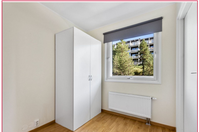
Soverom er av god størrelse med plass til dobbeltseng og skap.