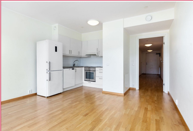
Lyst og moderne kjøkken.