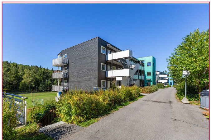
Velkommen til Seterbråtteien 115. Leiligheten ligger i øverste etasje.