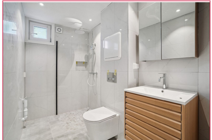
Flott flislagt bad. Dusjdører er montert.