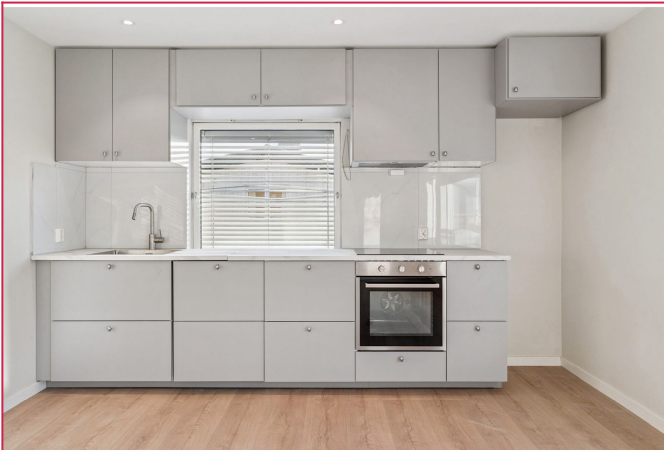
Helt nytt kjøkken.