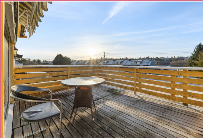
Flott og stor uteplass