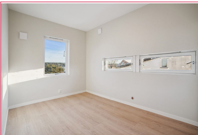
Leiligheten har totalt tre soverom.