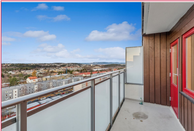
Balkong på 6 kvm.