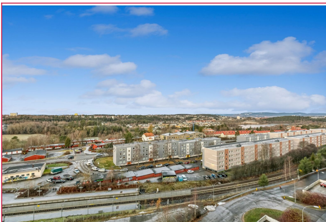
Utsikt fra stue/balkong.