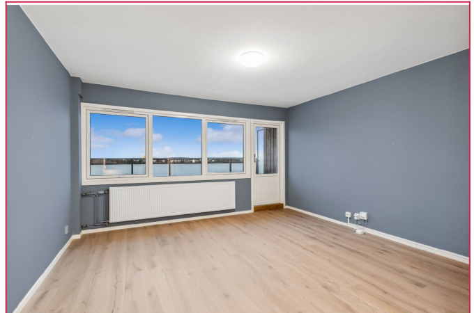
Leiligheten ble pusset opp i 2022.