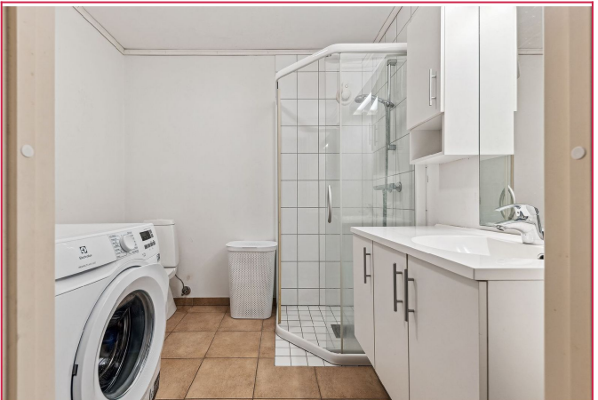
Bad av god størrelse