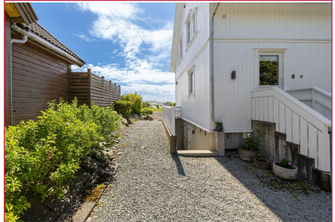
Innkjørsel og nedgang til dør