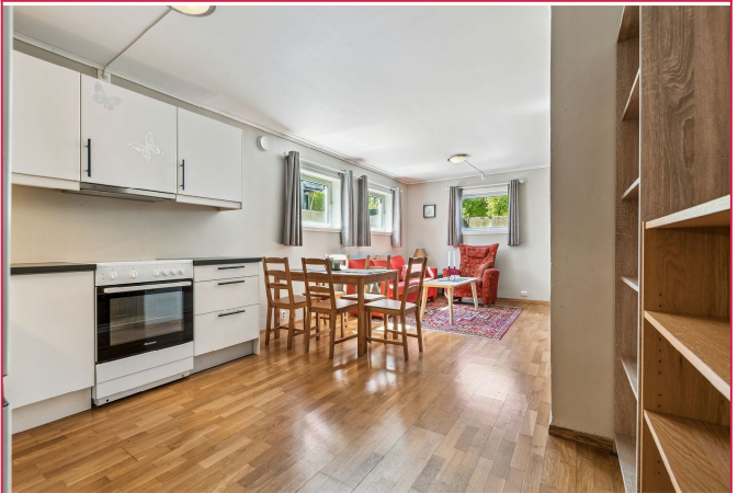
Hybelen har åpen løsning mellom kjøkken og stue/spisestue