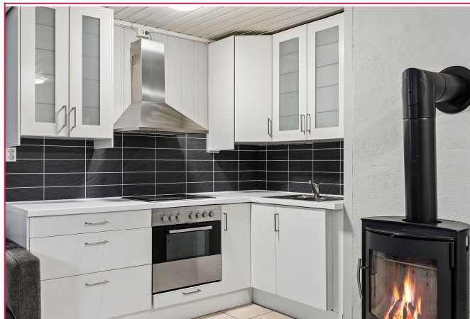
Pent kjøkken med integrerte hvitevarer og vedfyring.