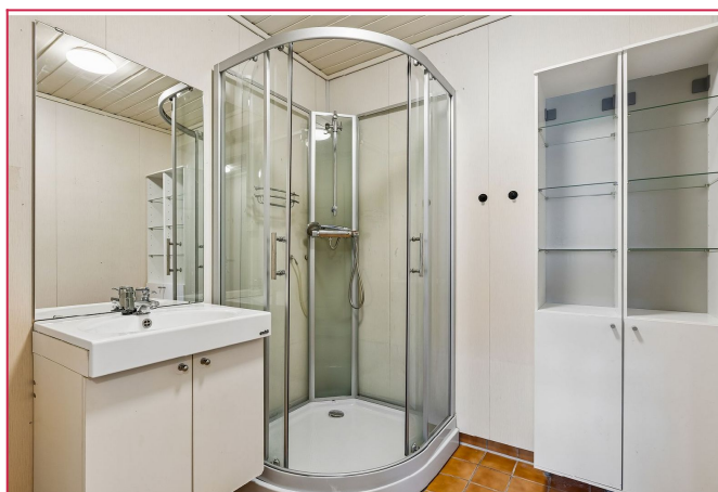
Bad med dusjkabinett, servant med underskap, og innredning. Varmekabler i gulv.