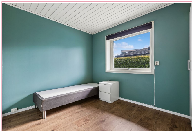
Soverom 2 er også innredet med garderobeskap.