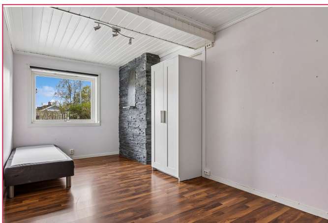
Soverom 3 er også innredet med garderobeskap.