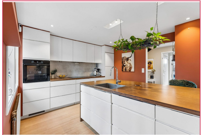
Moderne kjøkken med god skap-og benkeplass, samt integrerte hvitevarer.