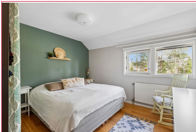
Hovedsoverom med god plass i garderobeskap.