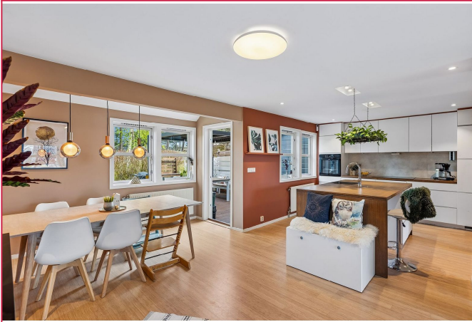
Romslig kjøkken i delvis åpen løsning mot stuen.