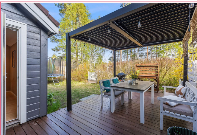
Fra kjøkkenet er det utgang til flott uteplass med plattning og egen hage.