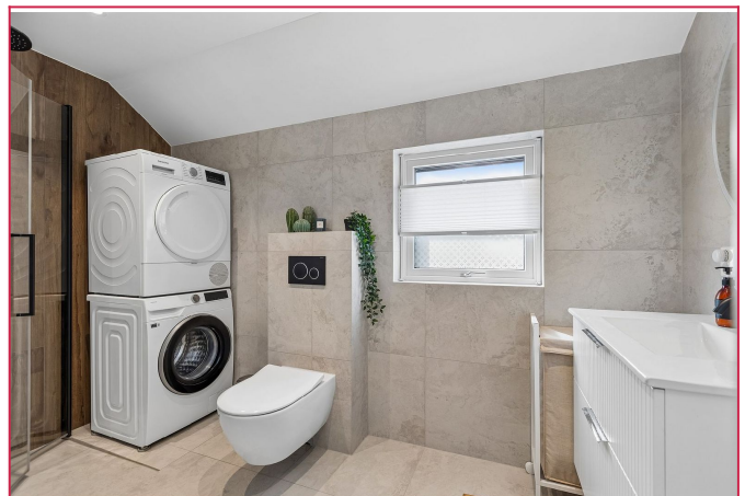
I boligens andre etasje finner du et moderne flislagt bad innredet med vaskemaskin og tørketrommel.