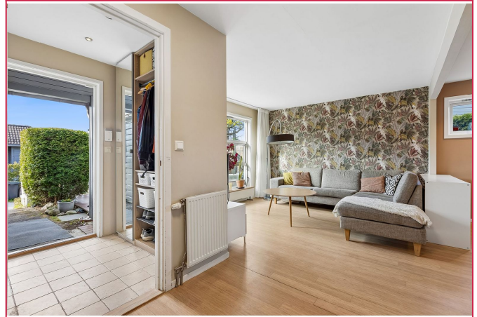
Fra gangen er det direkte tilgang til toalett og bod. Gangen er også innredet med garderobeskap.