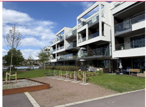
Velkommen til visning!