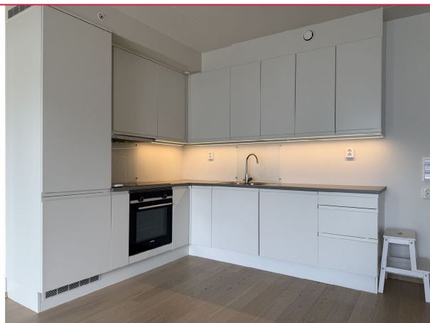
Flott kjøkken med hvite fronter. Godt med skap og benkeplass