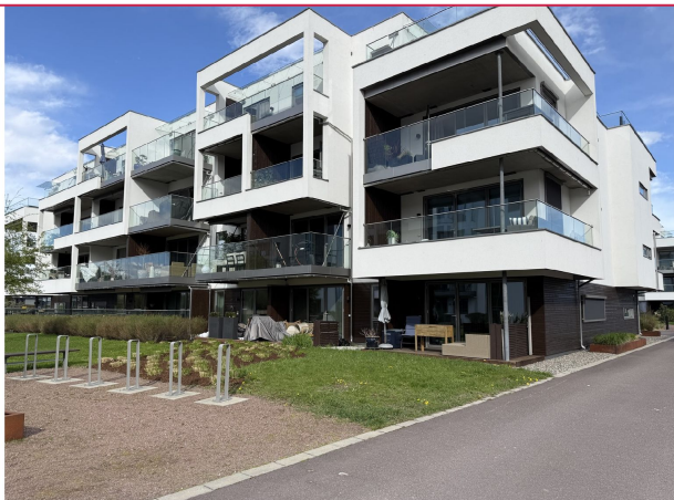
Leiligheten ligger i 3.etg! Flott beliggenhet på Husøy Havn!