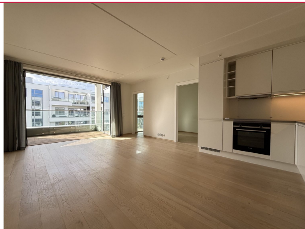
Åpen stue-og kjøkkenløsning