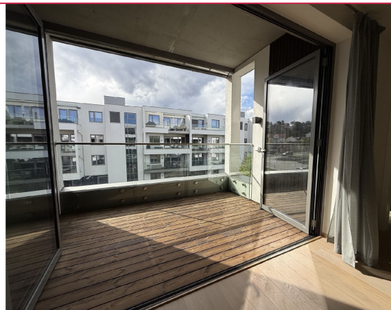
Stor balkong med terrassedører som kan skyves hele til siden