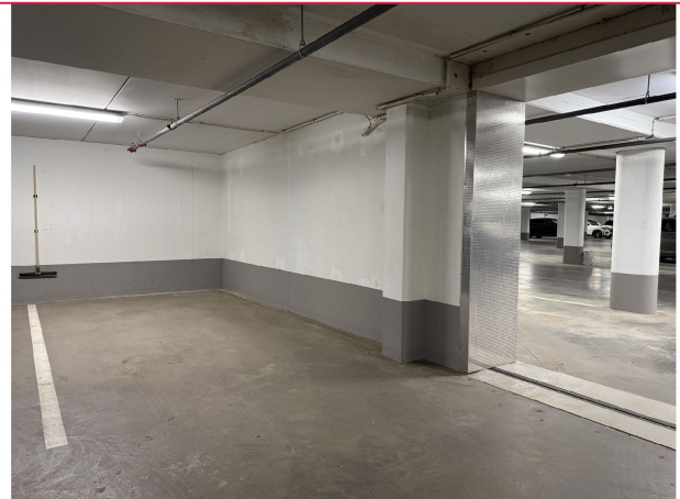
Egen parkeringsplass i kjeller