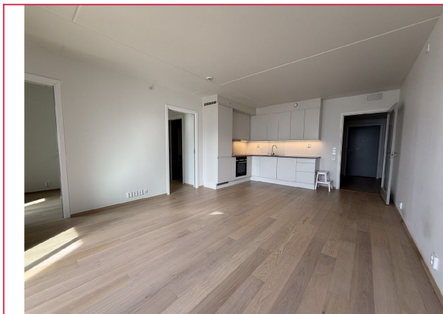
Åpen stue-og kjøkkenløsning