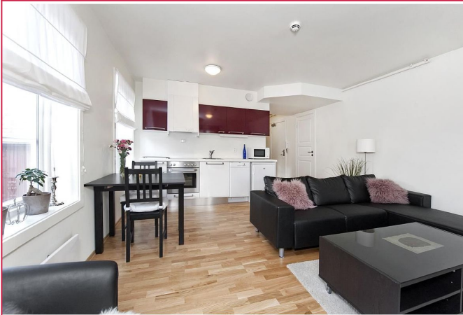
Stue med åpen kjøkkenløsning