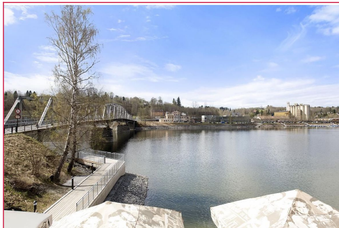
Utsikt mot elva