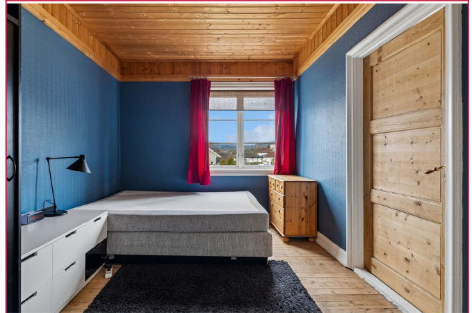
Leiligheten er delvis møblert og vil leies ut slik den er under visning.