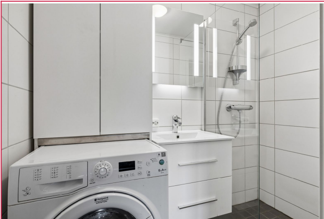
Baderommet er innredet - separat WC.