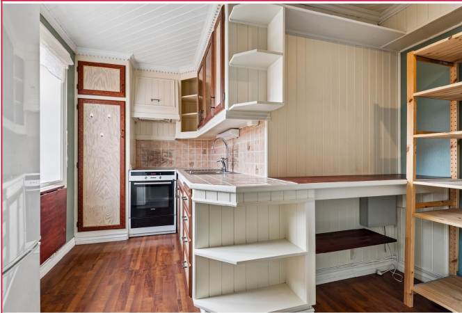
En 2 roms leilighet med god tilknytning til alle sentrumsfunksjonene Skien har å by på.