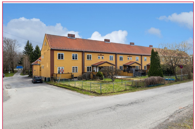
Velkommen til visning!