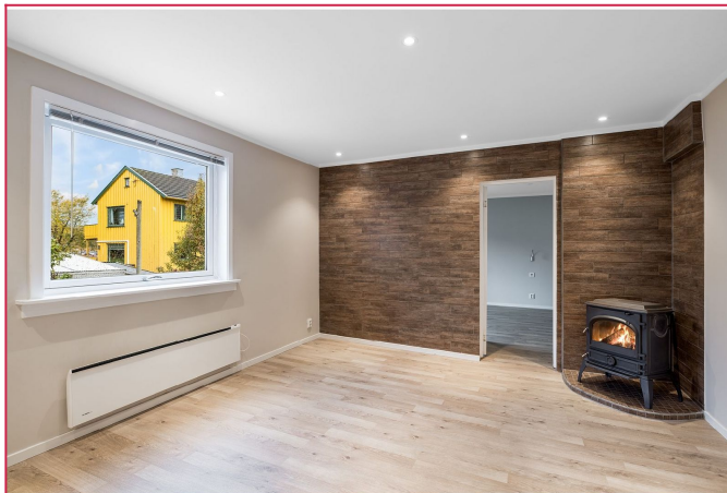
Stue med peisovn