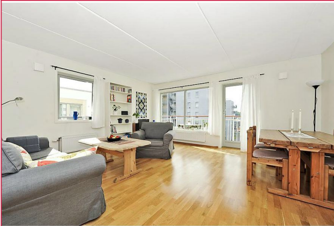
Romslig stue med utgang til balkong