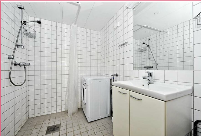
Flislagt bad med wc, servant, dusjhjørne og vaskemaskin