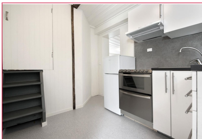
Inngang til praktisk liten hems fra kjøkkenet. Hemsen kan f.eks benyttes til bod/oppbevaring