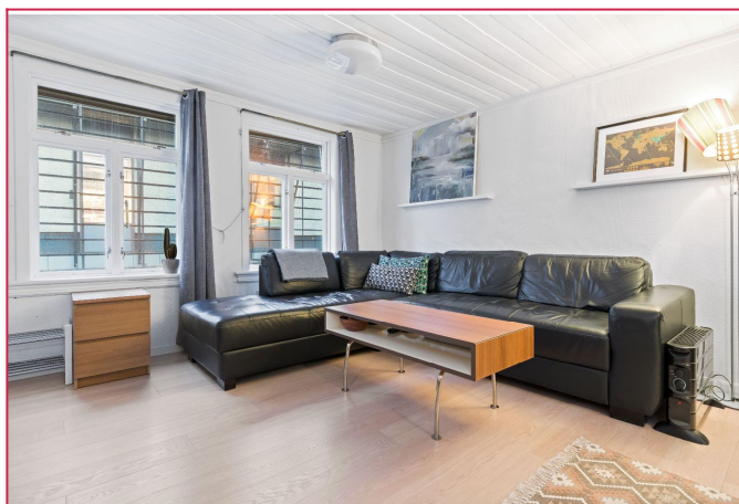
Store vinduer sørger for godt med naturlig lysinnslipp.