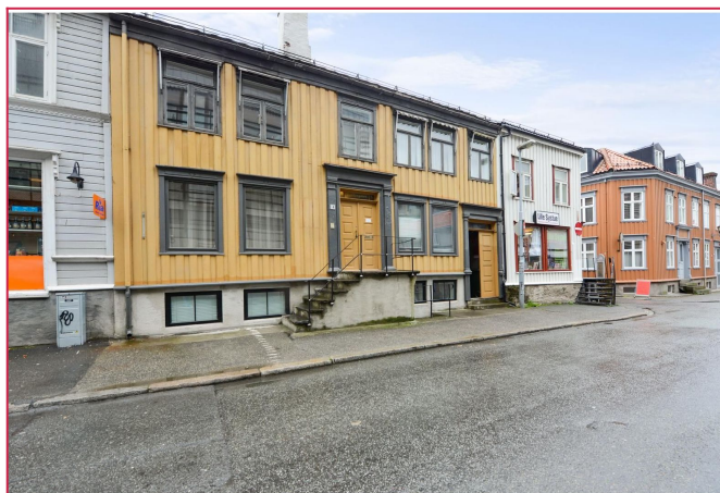
Fasade: Leiligheten ligger til venstre i 2.etg