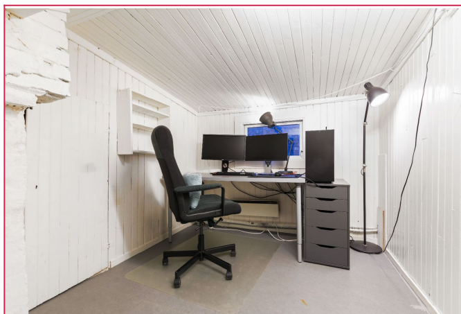
Hemsrom. Tidligere møblert ikke godkjent pga brannregler, kan brukes som bod/oppbevaring