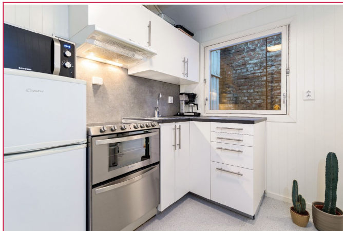
Kjøkkenet er utstyrt med kombikjøleskap og komfyr + oppvaskmaskin.