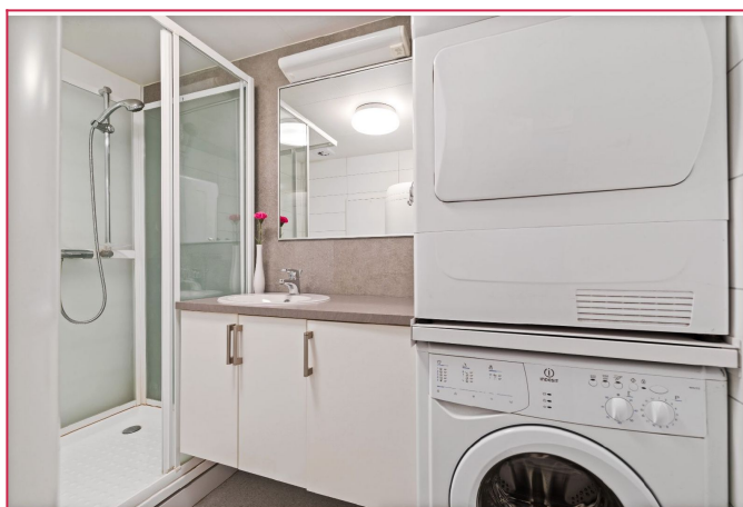
Pent bad med gulvvarme. Vaskemaskin medfølger.