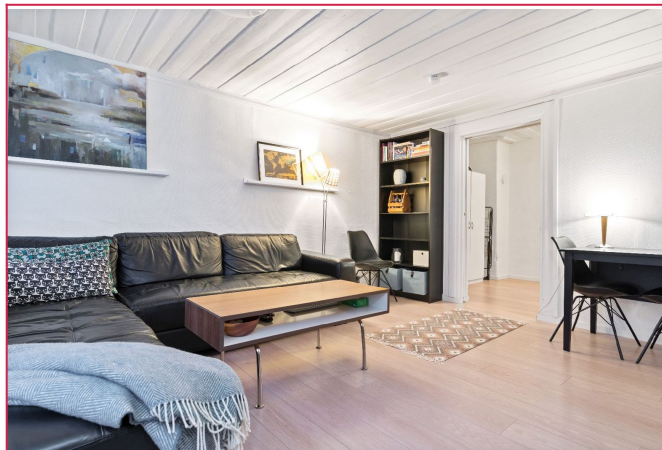
Leiligheten har en romslig stue med god plass til både sofakrok og spisebord.