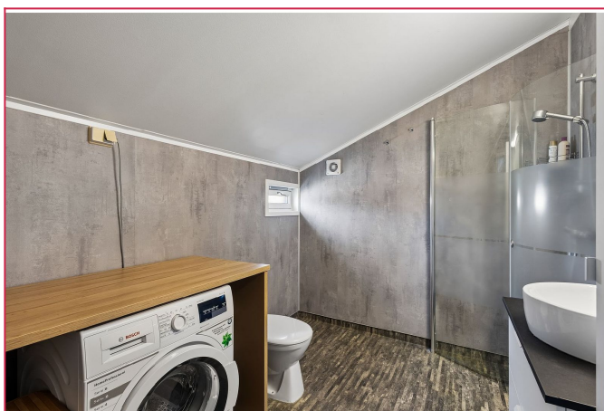
Oppusset bad med dusj, servant, WC og opplegg til vaskemaskin.