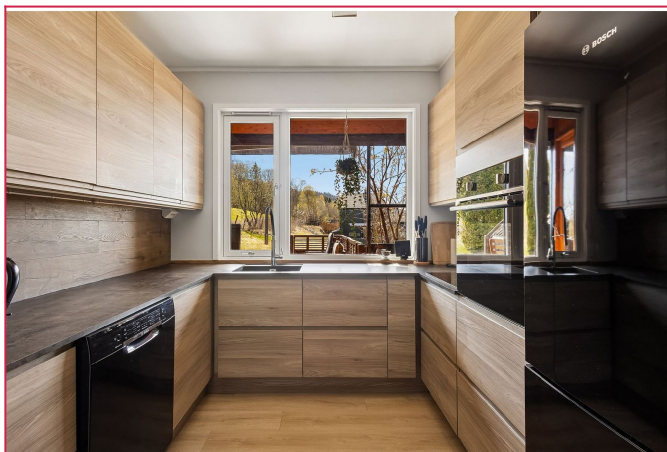
Moderne og estetisk kjøkken med hvitevarer. Godt av både skap- og benkeplass.