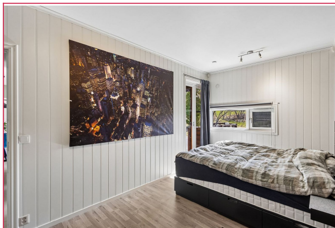
Leiligheten har to soverom. Dette er hovedsoverommet og det største av de to.