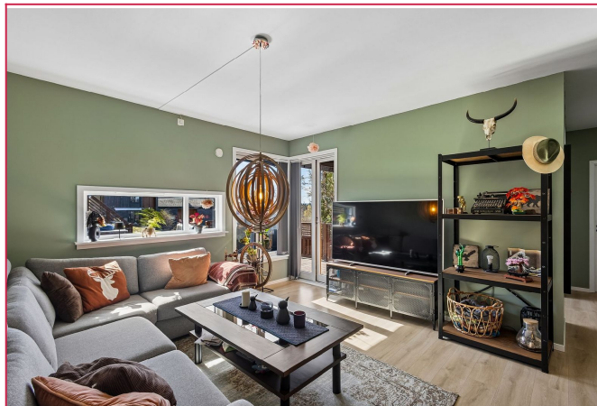
Lys og åpen stue med gode møbleringsmuligheter.