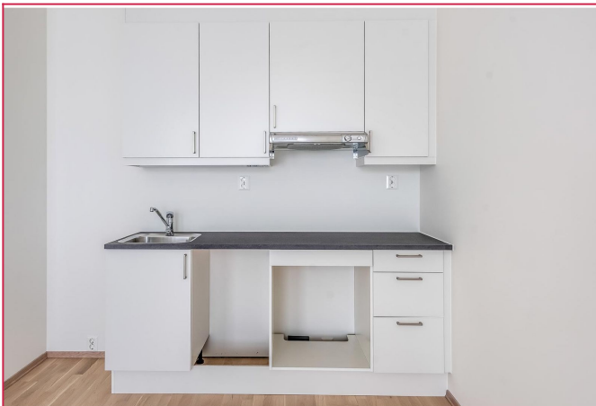
Kjøkkenet i kombinasjon med stue. Hvitevarer er satt inn.