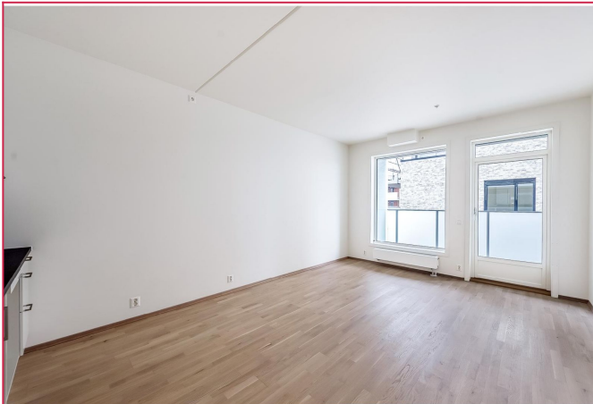
Stue med utgang til stor balkong