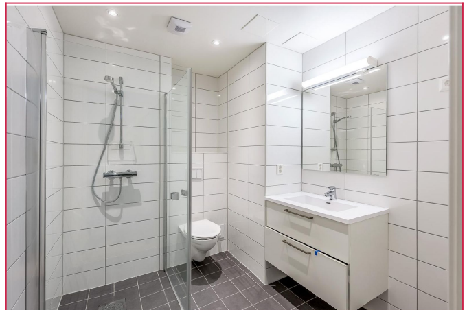
Flott flislagt bad med stort dusjhjørne