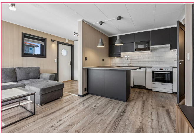
Leiligheten har en åpen stue- og kjøkkenløsning med utgang til stor plattform med gode solforhold.