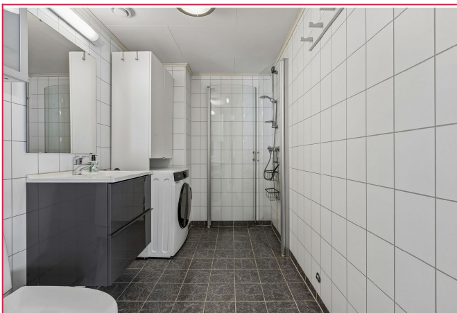
Lekker flislagt bad med gulvvarme, dusjhjørne og opplegg for vaskemaskin.