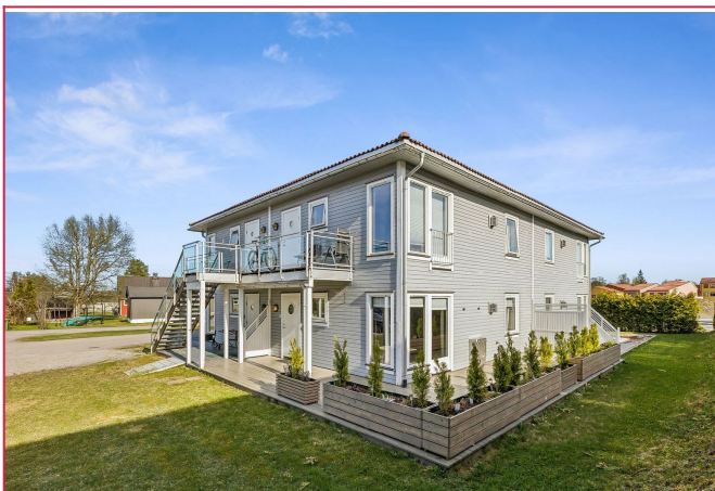
Velkommen til Vestengsletta 2E!