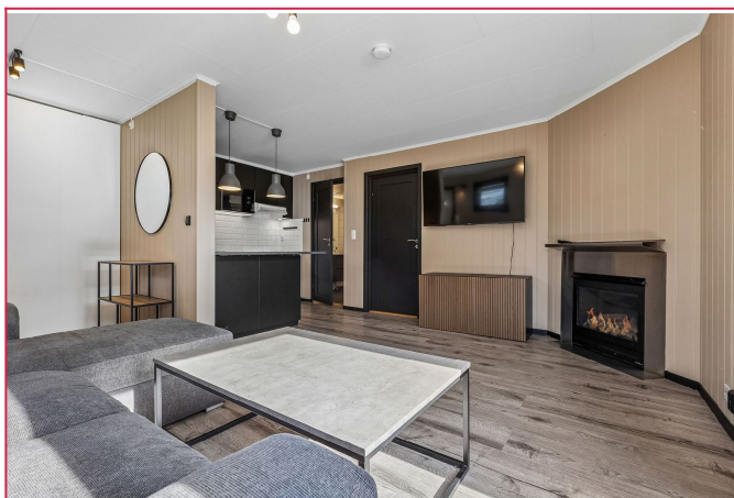
Lys og trivelig stue med hyggelig gasspeis som gir en lun og behagelig atmosfære.