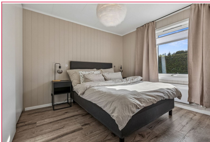
Soverom med dobbeltseng, nattbord og gode oppbevaringsmulighet.