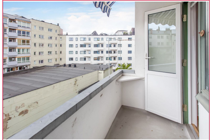
Balkong med gode solforhold