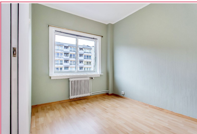
Soverom - Leiligheten har sentralfyring, varmt vann og internett inkludert i leien