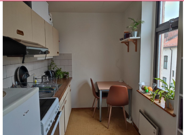
Kjøkkenet i delvis åpen løsning