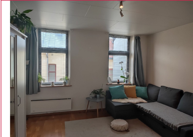
Stue med gode møbleringsmuligheter